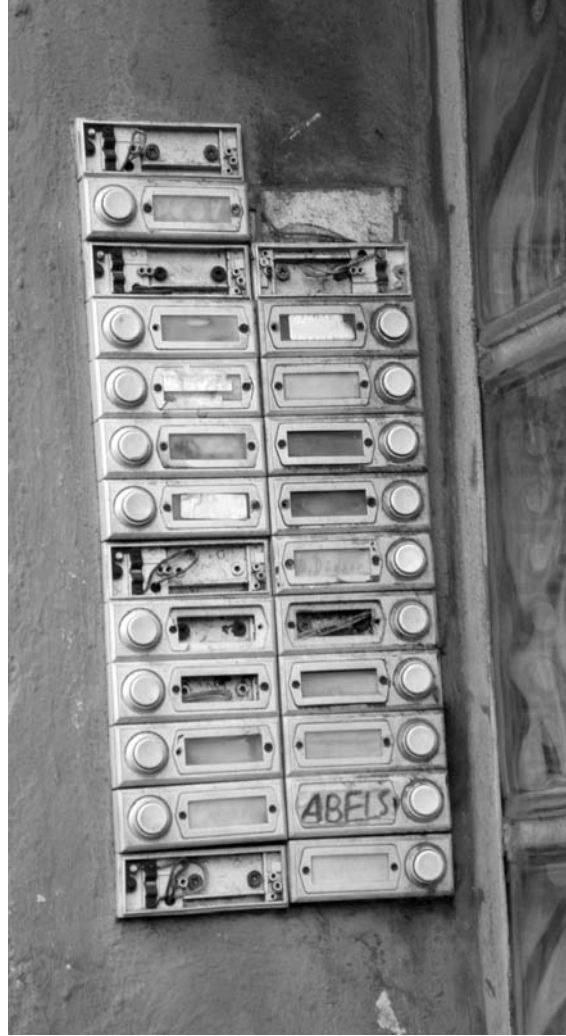
Marxloh 'da kapı silleri

Artan işsizlik ve düşük gelir nedeniyle evsiz barksız kalma ihtimali altında yaşayan veya çok daha kötü koşullarla karşılaşanların sayısı arttı. Bu sayı 2000 yılında 3.300 iken 2005'te 4.100'e yükselmiştir. Konutsuzluk tehlikesiyle karşı karşıya kalanların yaklaşık üçte biri çocuğunu tek başına yetiştiren kişilerden oluşmaktadır.